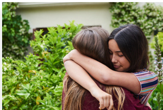
Texto: Fuente: Miriam: Nuestro primer verano seperadas, revista Bravo, Bauer Media Group, número 487, del 05/08/2014, Foto: © Flashpop/DigitalVision

Miriam, 14 (mail): ¡Hola! Todos los años me reúno con mi BF del verano en la playa. Pero me acabo de enterar de que se va a otro sitio y no nos vamos a pasar juntas las vacas, ¡será el peor summer de mi vida!