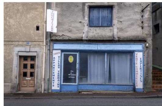
Une ancienne agence immobilière située dans le centre-ville d'une petite commune française. Photo datant du 7 février 2019.