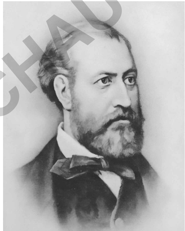
Charles-François Gounod (1818-1893)

Spielt die Anfangsmelodie des Stückes „Ave Maria“ auf beliebigen Instrumenten. Beginnt nach der Einleitung von vier Takten und wiederholt die Melodie dann beliebig oft.