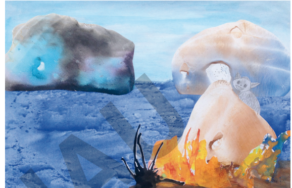
Planetenlandschaft mit Fantasietier

Die Entdeckung eines unbekanntes Wesens und die Reise zu wundersamen Planeten bilden den Rahmen dieser Unterrichtseinheit. Ausgehend von einer spannenden Geschichte werden hier Zufallsverfahren wie Frottage und Décalcomanie vermittelt und nach der spielerischen Erprobung in einer Collage miteinander kombiniert. Lassen Sie sich überraschen von den fantasievollen Planetenlandschaften, die dabei entstehen!