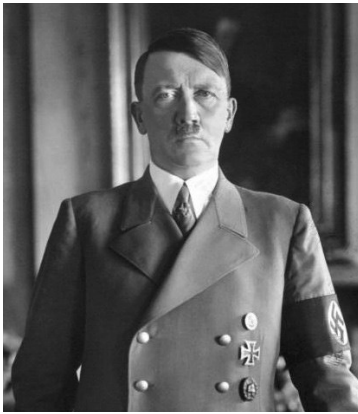
Adolf Hitler (1889–1945)

Bei der Wahl am 31.07.1932 wurde die Nationalsozialistische Deutsche Arbeiter Partei (NSDAP) stärkste Partei im deutschen Reichstag .