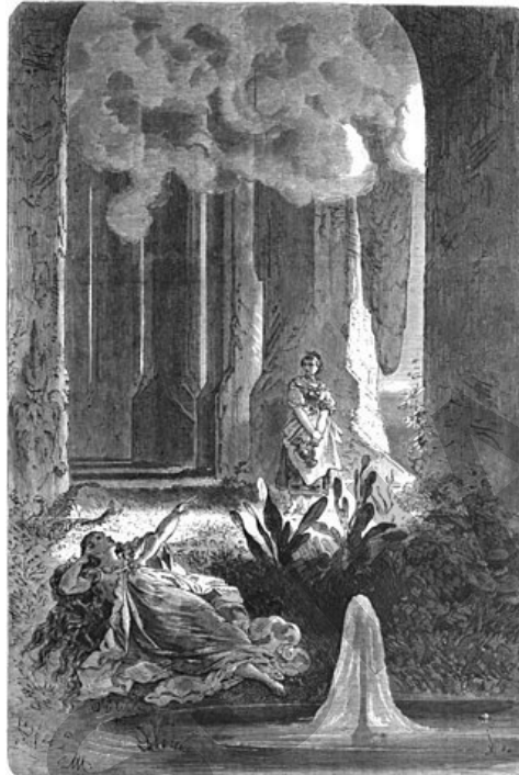
Von Anton commons.wikimedia.org/w/index.php?curid=51299097Muttenthaler (1820–1870) – Illustrierte Zeitung, 30. Juli 1864, S. 80 (Permalink), Gemeinfrei, https://