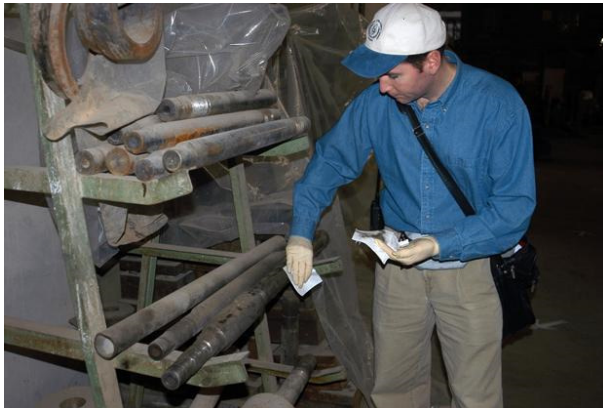
Ein Inspekteur der UN bei Kontrollen im Irak

Der Irak rückte nach dem Ersten Golfkrieg 1990/91, in dessen Folge man den irakischen Diktator Saddam Hussein im Amt belassen hatte, erst aufgrund der Terroranschläge vom 11. September 2001 wieder in den Mittelpunkt der US-Außenpolitik. Der amerikanische Präsident George W. Bush hatte sich nach seiner Wahl zunächst der Innenpolitik zugewandt, um dann eine auf Konfrontation ausgerichtete Außenpolitik umzusetzen. Zudem hatte sich der Irak den Unmut der US-Regierung zugezogen, da er sich als einziges Mitgliedsland der Vereinten Nationen der Verurteilung der Anschläge nicht angeschlossen