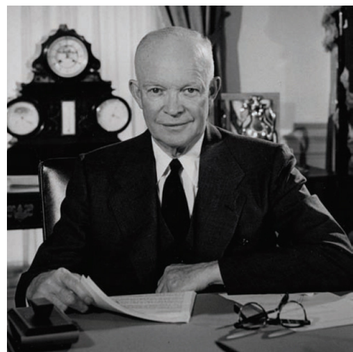
Dwight D. Eisenhower ( http://uenomurakami.files.wordpress.com/01.12.10 )