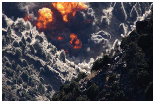
Luftangriffe auf Tora Bora ( http://en.wikipedia.org/04.12.10 )

Das militärische Vorgehen gegen die Taliban erwies sich rasch als erfolgreich. Am 9. November 2001 eroberte die Nordallianz die wichtige Stadt Mazar-i-Sharif, am 13. November auch die Hauptstadt Kabul. Den USA und ihren Verbündeten gelang es jedoch nicht, Osama bin Laden zu stellen und gefangen zu nehmen. Am 8. Dezember 2001 fiel die letzte Taliban-Hochburg Kandahar. Die Taliban und versprengte al-Qaida-Kämpfer zogen sich in das unwegsame pakistanisch-afghanische Grenzgebiet zurück. Im Dezember 2001 bombardierten die USA die Bergfestung Tora Bora bei Jalabad, wo Osama bin Laden vermutet wurde. Dieser entkam jedoch höchstwahrscheinlich. Bis heute konnte nicht zweifelsfrei geklärt werden, ob bin Laden noch am Leben ist.