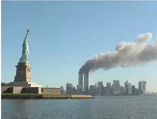
Die qualmenden Türme des World Trade Centers ( http://de.wikipedia.org/01.12.10 )

Die Anschläge auf die USA am 11. September 2001 stellen einen entscheidenden Wendepunkt in der Geschichte der Vereinigten Staaten dar. Beinahe gleichzeitig hatten 19 al-Qaida-Terroristen vier Passagier-Flugzeuge entführt und auf Ziele in den USA zugesteuert. Um 8:45 schlug eines der Flugzeuge in den nördlichen Turm des World Trade Centers in New York ein. Zunächst ging man dabei noch von einem Unfall aus. Doch spätestens als um 9:05 Ortszeit ein zweites Flugzeug in den Südturm des Gebäudes raste, war für die Sicherheitsbehörden und die Presse offensichtlich geworden, dass es sich um einen terroristischen Anschlag handeln musste.