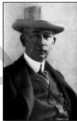
Edward Mandell House