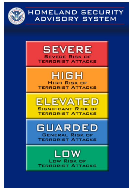
Die von der Homeland Security ausgesprochenen Warnstufen ( http://de.wikipedia.org/01.12.10 )

Auch in der Innenpolitik nahm die US-Regierung im Hinblick auf die innere Sicherheit Änderungen vor. Am 25. Oktober 2001 verabschiedete der Kongress – unter dem Druck der Ereignisse – in einem Bundesgesetz den USA PATRIOT Act. Das Gesetz soll in erster Linie dazu dienen, die Ermittlungen der Bundesbehörden im Fall einer terroristischen Bedrohung zu vereinfachen. Einige Grundrechte wurden dabei entscheidend verändert. Unter anderem ist es nun möglich, Menschen ohne US-amerikanische Staatsbürgerschaft, die unter Terrorismusverdacht stehen, ohne Gerichtsverfahren auf Anweisung für unbestimmte Zeit festzuhalten. Zusätzlich zu diesem Bundesgesetz wurde 2002 das United States Department of Homeland Security (Heimatschutzministerium) eingerichtet, dem die Aufgabe zufällt, die amerikanische Bevölkerung und die Staatsgebiete vor terroristischen und anderen Bedrohungen zu schützen.