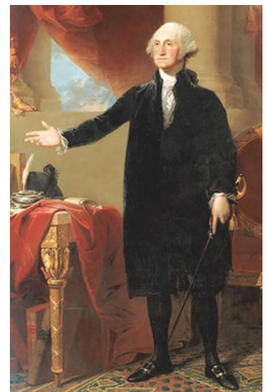
George Washington