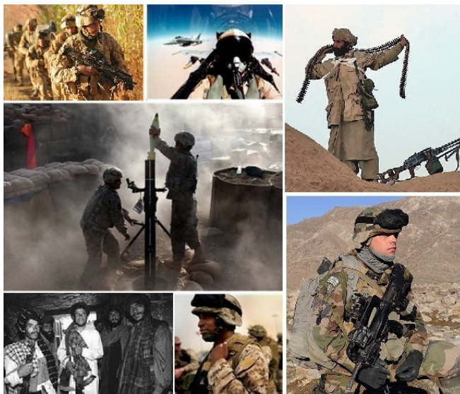
Szenen aus dem Krieg in Afghanistan

Im Anschluss an die Anschläge des 11. September 2001 forderten die USA vom in Afghanistan regierenden Taliban-Regime die Auslieferung Osama bin Ladens. Erwartungsgemäß lehnte das Regime dessen Auslieferung ab. Daraufhin begannen die USA mit britischer Unterstützung am 7. Oktober 2001 mit Luftangriffen auf Afghanistan. Zeitgleich rückte aus dem Norden des Landes die oppositionelle Nordallianz – ein Zweckbündnis verschiedener afghanischer Interessengruppen, das sich seit Jahren im Kampf gegen die Taliban befand – mit ihren Truppen vor.