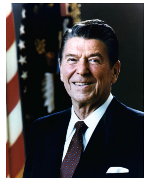
Ronald Reagan