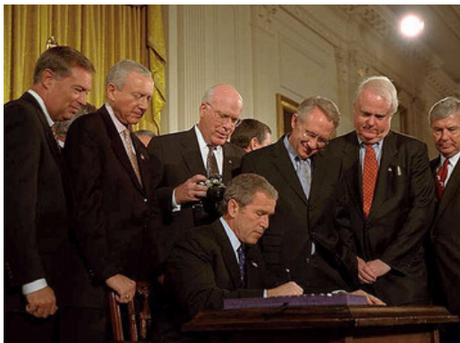
Die Unterzeichnung des USA PATRIOT Acts durch den Präsidenten

Die Anschläge des 11. September 2001 führten zu einem grundlegenden Wandel in der amerikanischen Außenpolitik. Präsident George W. Bush verkündete die Basis dieser Neuausrichtung in einer Rede am 20. September 2001 vor beiden Kammern des Kongresses. Er forderte die internationale Staatengemeinschaft dazu auf, sich dem Krieg gegen den Terror anzuschließen. Staaten, die sich diesem Krieg verweigerten, würden sich unzweifelhaft der Komplizenschaft mit den Terroristen verdächtig machen. „Jede Nation muss sich nun entscheiden: Entweder seid ihr auf unserer Seite oder auf der der Terroristen.“ Bereits ein Jahr später wurde eine National Security Strategy verabschiedet, die man auch