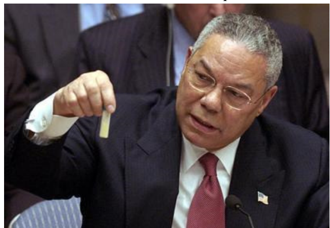
Verteidigungsminister Colin Powell präsentiert vor dem Sicherheitsrat der UN angebliche Beweise.

Als Hauptgründe für das militärische Vorgehen gegen den Irak führte der amerikanische Verteidigungsminister vor dem UN-Sicherheitsrat an, dass der irakische Diktator Saddam Hussein über Massenvernichtungswaffen verfüge und dass er zweifelsfrei in die Anschläge vom 11. September verwickelt gewesen sei. Mittlerweile haben sich beide Behauptungen als falsch erwiesen und der ehemalige amerikanische Präsident George W. Bush hat dies auch öffentlich zugegeben.