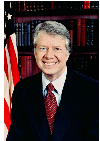
Jimmy Carter