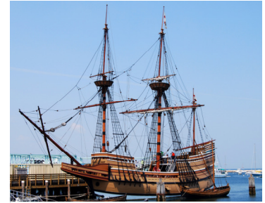
Nachbildung der Mayflower: Mayflower II in Plymouth