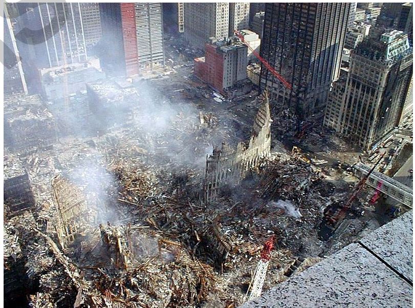
Die Trümmer des World Trade Centers ( http://de.wikipedia.org/01.12.10 )

Bei den Anschlägen vom 11. September starben mehr als 3000 Menschen, mehr als doppelt so viele wurden verletzt.