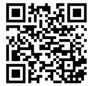
So funktioniert es!

So begleitet dich Ivi auf deinem Weg durch die faszinierende Welt der Immunbiologie: