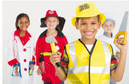
In jedem Beruf finden sich Besonderheiten

G emeinsam mit Ihrer Klasse werfen Sie einen Blick in die Berufswelt und finden dabei eine Vielzahl von Nomen. Bei dem Stationentraining entdecken Ihre Schüler eine Fülle von Nomen, die mit verschiedenen Berufen zu tun haben. Die Nomen werden Berufen zugeordnet, Werkzeuge entdeckt und bei weiteren abwechslungsreichen Stationen beweisen die Schüler ihr Können im Umgang mit Nomen. Spaß und Freude bei den Übungen vermitteln zusätzlich noch zwei Spiele.