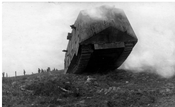
Deutscher Sturmpanzer an der Westfront, 1917/18

Ebenfalls zum ersten Mal wurden in einem Krieg Panzer eingesetzt. Die Engländer verwendeten sie, um Drahtverhaue und Schützengräben der deutschen Stellungen zu überrollen. Da die Panzerproduktion geheim ablaufen sollte, sagte man den Arbeitern, dass sie bewegliche Wasserbehälter herstellten. So kam es zu dem englischen Begriff „tank“ für Panzer. Einen durchschlagenden Erfolg hatte der Einsatz von Panzern aber zunächst nicht. Die Fahrzeuge waren noch nicht sehr zuverlässig. Sie verbreiteten aber unter den Soldaten Angst und Schrecken.