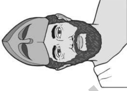
Perikles, Staatsmann und Feldherr