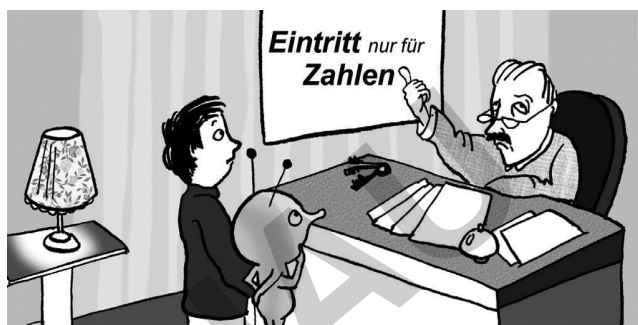
Im Hotel Infinite haben nur Zahlen Zutritt.

Im Hotel Infinite angekommen, sehen Tim und Tareck im dämmrigen Schein der Lampen einen grimmigen Mann an der Rezeption sitzen. Auf einem großen Schild steht: Eintritt nur für Zahlen . In einem freundlichen Ton fragt Tim den Mann: „Könnte ich meinem Freund das Hotel zeigen?“ Der Mann verdreht die Augen und zeigt kommentarlos auf das Schild. „Verflixt noch mal“, denkt Tim, „ich hab' ganz vergessen, dass nur Zahlen Zutritt haben.“ Er will seinen Denkfehler nicht zugeben und erklärt Tareck stattdessen, wie die Zahlen auf die Hotelzimmer verteilt werden.