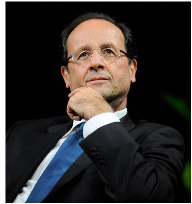
https://commons.wikimedia.org/wiki/File:Fran%C3%A7ois_Hollande_Journ%C3%A9es_de_Nantes.jpg , Author: Jean-Marc Ayrault (cc) (20.06.13)

Die Bevölkerungen respektierten sich zwar, sagt Le Maire, aber die Kultur und die politische Tradition der beiden Länder seien in vielerlei Hinsicht gegensätzlich, auf beiden Seiten lernten immer weniger Menschen die Sprache des anderen, und in der Konstruktion Europas verfolgten beide Länder grundsätzlich unterschiedliche Vorstellungen. Er sagt: „Das Verhältnis zwischen unseren beiden Ländern ist schwierig. Das müssen wir anerkennen. Das müssen wir als Ausgangspunkt nehmen.“ Er ruft zu einer neuen Ehrlichkeit, zu Nüchternheit im Umgang miteinander auf: „Während Jahrzehnten ging es in der deutsch-französischen Beziehung darum, die beiden Länder einander näherzubringen, eine ‚deutsch-französische Freundschaft‘ zu schaffen. Aber das reicht heute nicht mehr.“ Er sagt: „Wir müssen von der einfachen Feststellung ausgehen, dass die Beziehung nicht natürlich ist. Wenn man von der falschen Vorstellung ausgeht, dass sie einfach sei, ist man die ganze Zeit enttäuscht.“