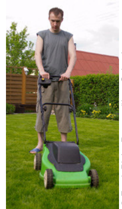
Er mäht den Rasen.