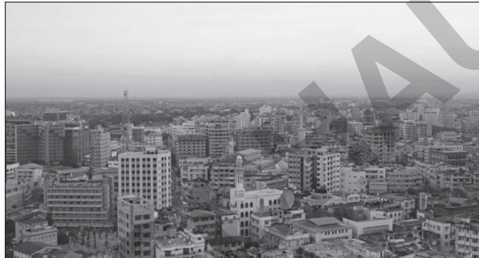
Dar es Salaam, Tansania

5 Nach einem Zwischenhalt in der größten Stadt Tansanias, Dar es Salaam, in der wir rechtliche Dinge wegen unseren Visa klären mussten, ging es am nächsten Morgen wieder an den Flughafen, um nach Mwanza weiterzufliegen. Ich kann mich noch sehr gut an meine Gedanken in Dar es Salaam erinnern: „Oh mein Gott, es ist voll, heiß, dreckig und jeder langt dich an! Ich will hier wieder weg!“