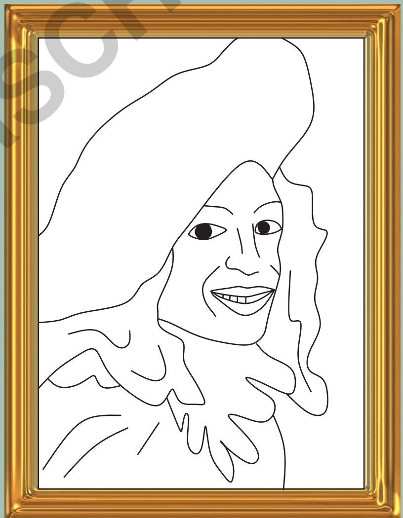
Aus: Jan Vermeer

So unterschrieb er die Bilder. Setze deine Unterschrift dazu und netzwerk lernen