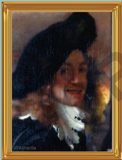
Male Jan Vermeer an.

als Kunstexperte und Kunsthändler. Im Alter aber war er sehr arm. Obwohl Jan Vermeer nur 37 Bilder schuf, gehört er zu den bedeutendsten niederländischen Künstlern mit seinem feinen Malstil und seiner frischen und kühlen Farbgebung. Vincent van Gogh schrieb über ihn begeistert: „Es stimmt, dass man in den paar Gemälden, die er gemalt hat, die ganze Farbtonleiter finden kann ...“ Er gehört zu den Großen in der Kunstgeschichte.