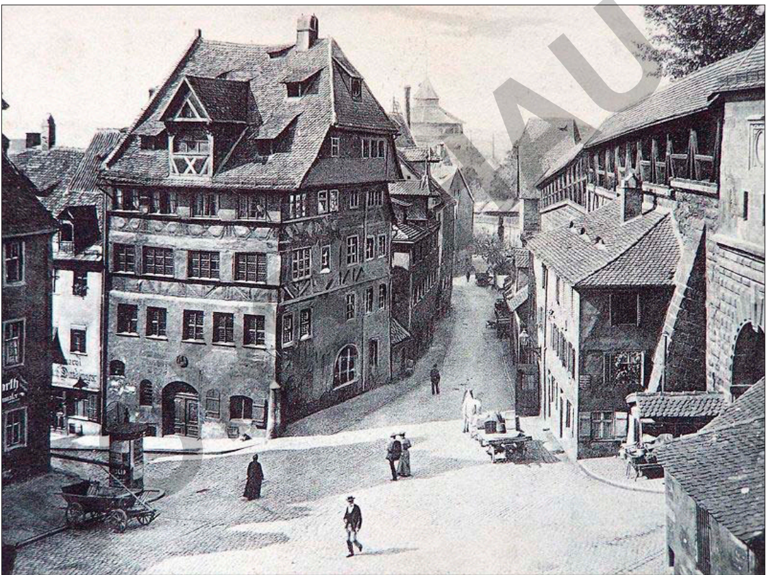
Bild der Stadt Nürnberg