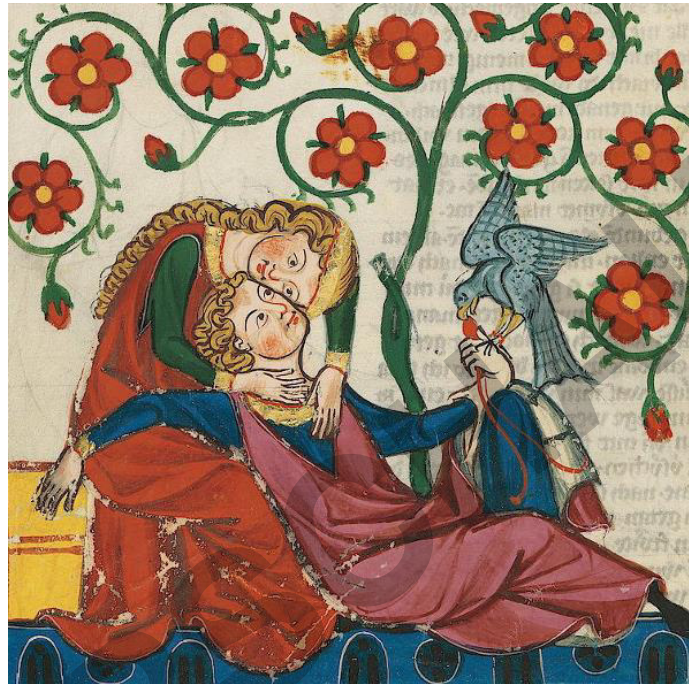
Wie sah eine Ehe im Mittelalter aus?

In allen Kulturen beglückt die innige, gegenseitige Liebe zwischen Mann und Frau das Leben der Menschen. Was kann es Schöneres geben als eine Bindung, die allen Widrigkeiten des Lebens trotz? Die Geschichte des Abendlandes lehrt aber, dass Frauen trotz der Liebe des Mannes in der Ehe nicht gleichberechtigt waren und sich viele menschliche Grundrechte erst erkämpfen mussten. Mithilfe eines Auszugs aus dem mittelalterlichen Text Gesta Romanorum lassen Sie Ihre Klasse einer Fürstin über die Schulter schauen und erleben, wie es ihr in ihrer Ehe ergeht. Viele produktive Unterrichtstechniken wie z. B. Standbild, Perspektivenwechsel oder kreatives Schreiben unterstützen die Phase der Interpretation.