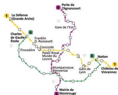
Die übereinandergelegten Folienstreifen.

Von M 3 erstellt die Lehrkraft zwei Kopien auf dickerem Papier und schneidet die Karten aus. Laminieren erhöht die Lebensdauer der Karten.