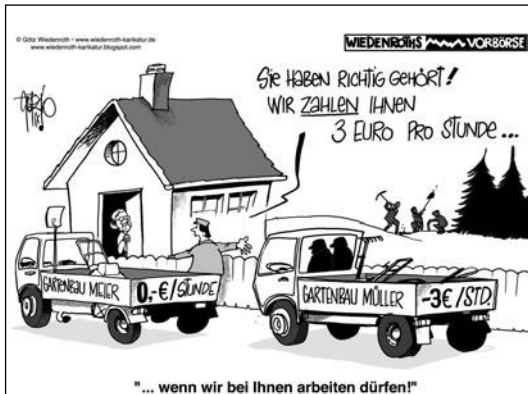
(aus: www.wiedenroth-karikatur.de )