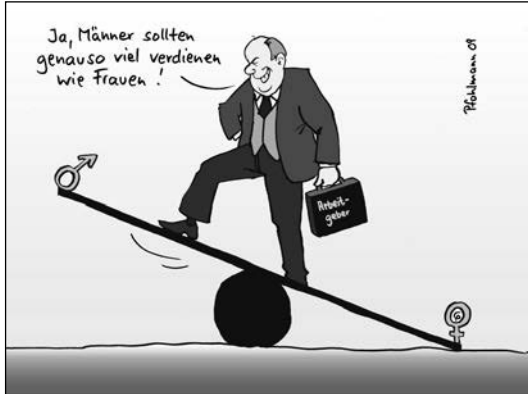
(von Chr. Pfohlmann)

Betrachten Sie die folgenden Karikaturen und beschreiben Sie, welchen Missstand sie kritisieren.