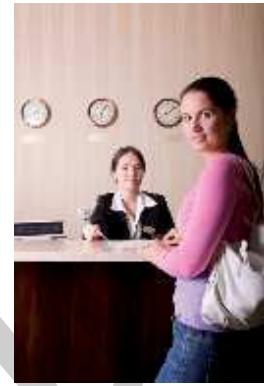
A hotel in Alice Springs