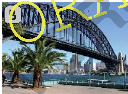
Sydney Harbour Bridge

Dad: Mhm ...? Was ist das Besondere an Sydney?