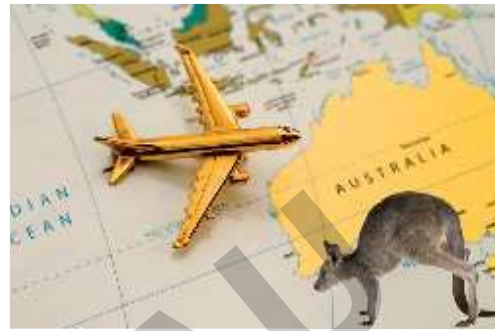
Australia – a continent to be discovered.