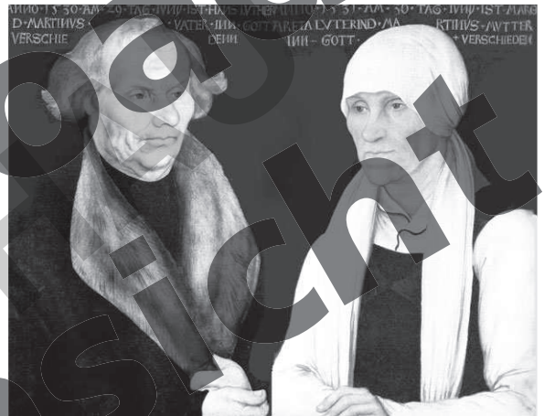
Hans und Margarethe Luther

Martin machte einen sehr guten Schulabschluss, sodass sein Vater darauf sparte, ihm ein Studium der Rechtswissenschaften zu ermöglichen.