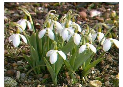
Schneeglöckchen zeigen den Frühling