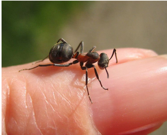
Eine rote Waldameise.

Sie ist nicht viel größer als ein Fingernagel und wiegt nur ein paar Gramm. Und doch hat sie Superkräfte - die Waldameise. Dieses bewundernswerte Insekt kann das 15fache seines eigenen Körpergewichtes tragen (Das ist ungefähr so, als wenn ihr einen Kleinwagen anheben müssten).