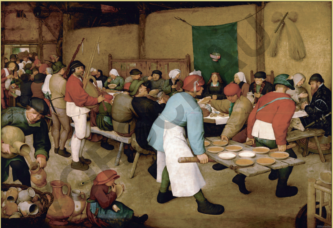
Pieter Bruegel d. Ä. Bauernhochzeit 1568