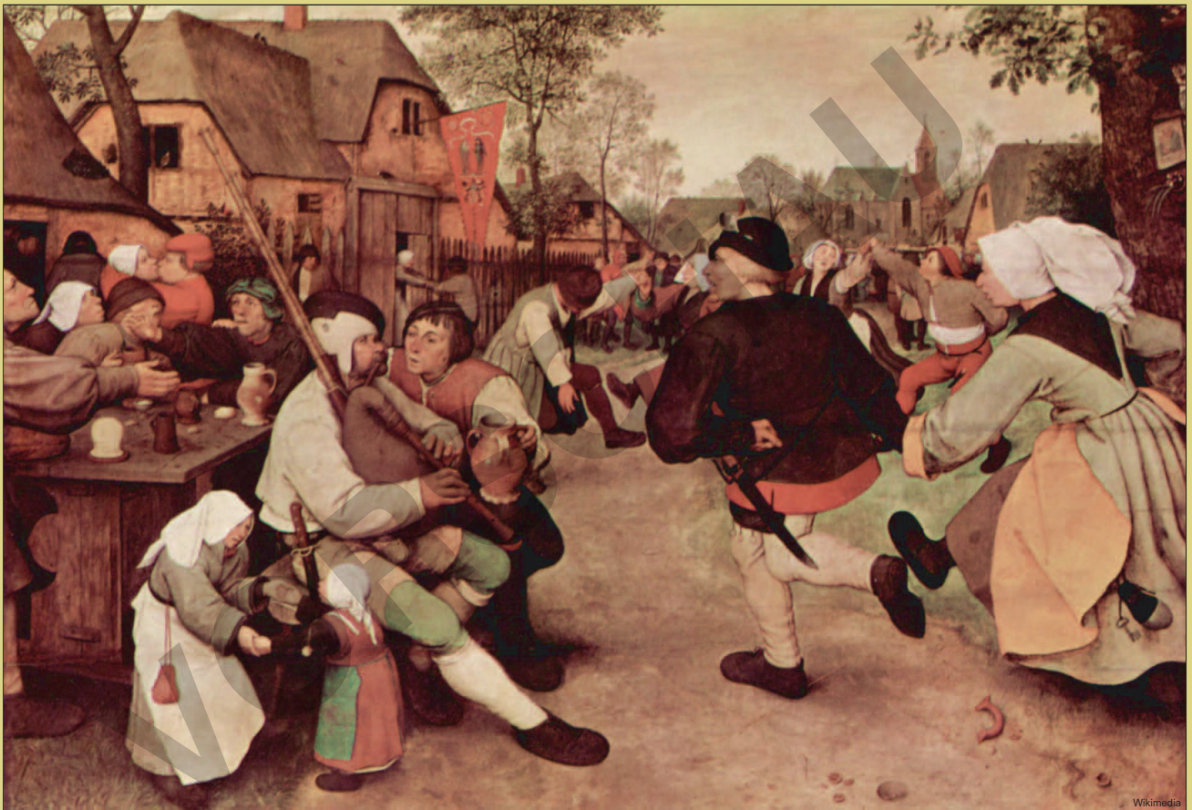
Pieter Bruegel Bauerntanz um 1568

Wikimedia Eckhard Berger www.teambergerf.de