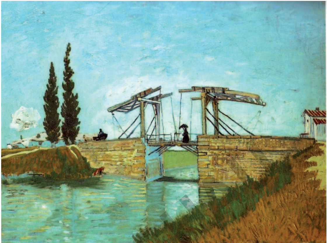
Vincent van Gogh Die Brücke von Arles 1888