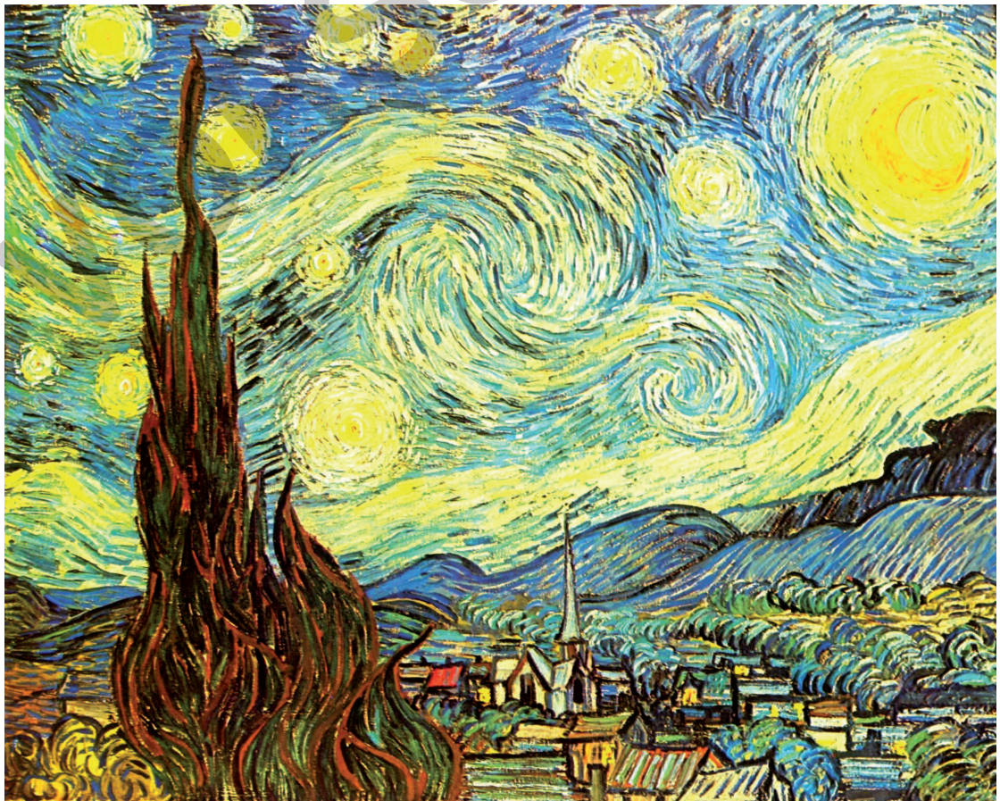
Vincent van Gogh Sternennacht 1889