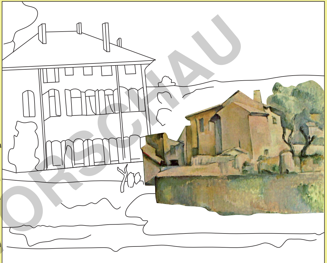
Paul Cézanne Das Landgut Jas de Bouffan 1885-1887

Das von 1885 bis 1887 entstandene Gemälde Das Landgut Jas de Bouffan zeigt das von seinem Vater gekaufte große Anwesen mit den Nebengebäuden, in dem Paul Cézanne arbeitete und mit seiner Familie wohnte. Es war gelblich angestrichen, hatte ein rotes Dach und war mit viel Grün umgeben. Er stellte es oft in seinen Bildern da, weil es zu seinen Lieblingsmotiven gehörte. Male das Bild an.