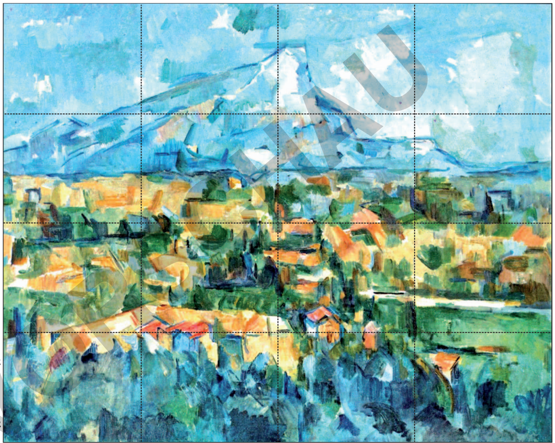
Paul Cézanne Mont Sainte-Victoire 1904

Die Landschaft um Montagne Sainte-Victoire, ein Gebirge, war für ihn eines der sehr wichtigen Motive. Dabei betrachtete er sie ganz genau, um sie richtig darzustellen. So schuf er von ihr über 30 Ölbilder und 45 Aquarelle. Klebe das Bild auf einen Karton und schneide es mit einer Schere auf den Linien in Teile und lege es wie ein Puzzle zusammen.