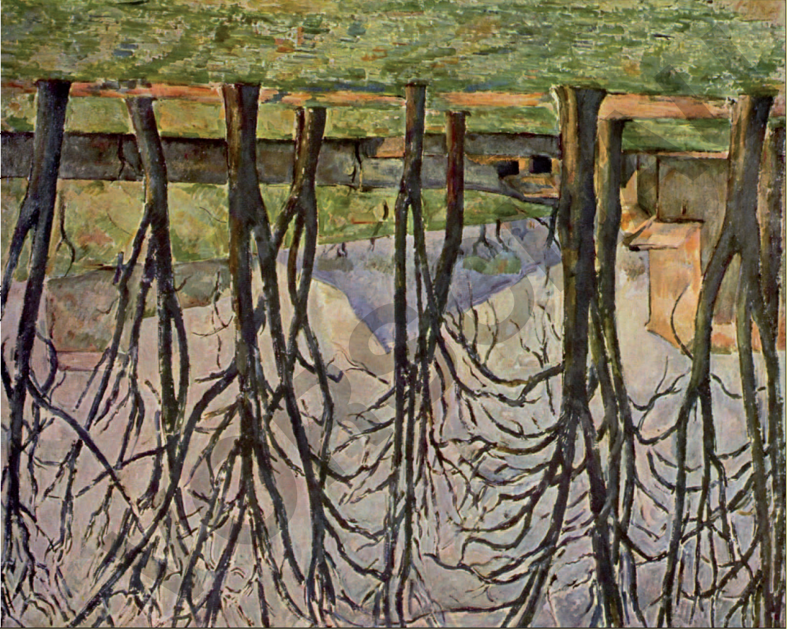
Paul Cézanne Kastanienbäume in Jas de Bouffan 1885-1887

Paul Cézanne erfreute sich an den Bäumen bei seinem Haus. Klebe rechts ein weiteres Blatt Papier an und zeichne mit dem Stift in Braun die Bäume als Reihe weiter. Orientiere dich an seinem Stil.