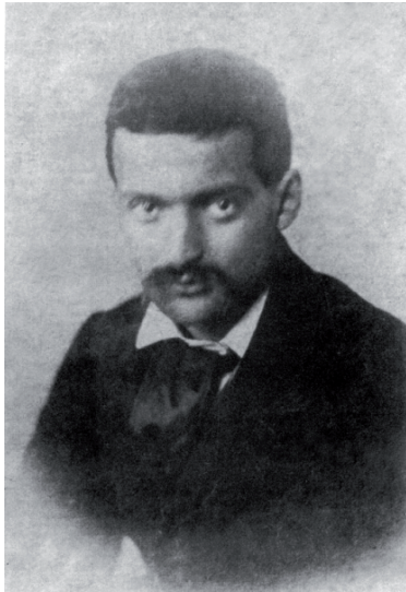
Paul Cézanne Fotoporträt 1861

Paul Cézanne - Anmalen und weitergestalten gehört zu der neuartigen Schulmalbuchreihe, die wahlweise als Schülerarbeitsbuch oder als Kopiervorlagenwerk einsetzbar ist. Sie führt konzeptionell innovativ und genial einfach direkt in das Leben und in das Werk der großen internationalen Künstler aus Vergangenheit und Gegenwart ein. Schülerinnen und Schüler aller Klassen und Schulformen erwerben begeistert Wissen, malen Bilder farbenprächtig an und gestalten sie ideenreich weiter. Mit fantastischen Ergebnissen belohnen sie sich und werden schnell Kunstexperte. Lehr- und Lerneffizienz sind garantiert.