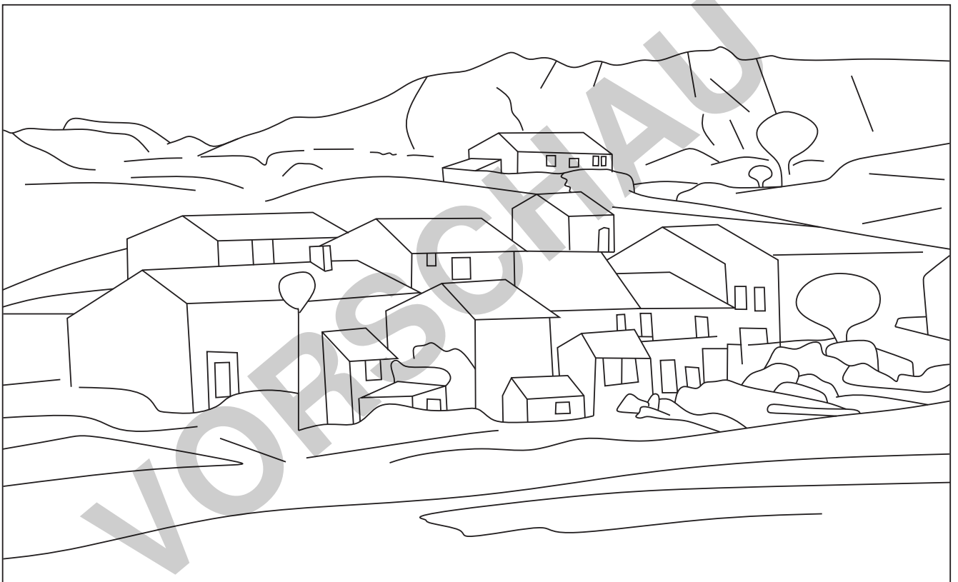
Paul Cézanne Montagne Sainte-Victoire (von der Umgebung bei Gardanne aus gesehen) 1886-1890

... und male dieses Bild mit viel Blau, Orange und Grün an.