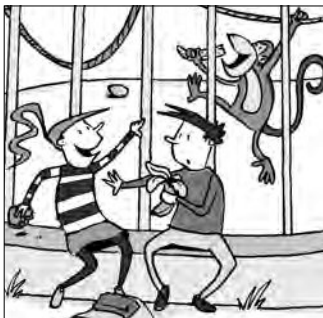
Timo • verwundert • Affe • Banane • isst