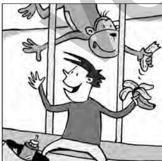
klaut • Banane • Affe