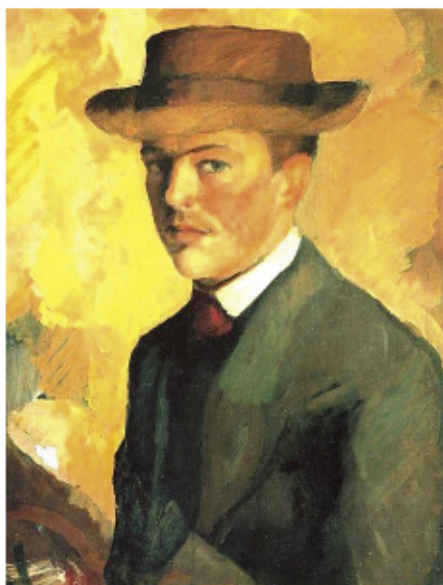
August Macke Selbstporträt mit Hut 1909

August Macke - Anmalen und weitergestalten gehört zu der Kunstreihe, die wahlweise als Schülerarbeitsbuch oder als Kopiervorlagenwerk einsetzbar ist. Sie führt konzeptionell neuartig, innovativ und genial einfach direkt in das Leben und in das Werk der großen internationalen Künstler aus Vergangenheit und Gegenwart ein. Schülerinnen und Schüler aller Klassen und Schulformen erwerben begeistert Wissen, malen Bilder farbenprächtigt an und gestalten sie ideenreich weiter. Mit fantastischen Ergebnissen belohnen sie sich selbst und werden schnell Kunstexperte. Lehr- und Lerneffizienz sind garantiert.