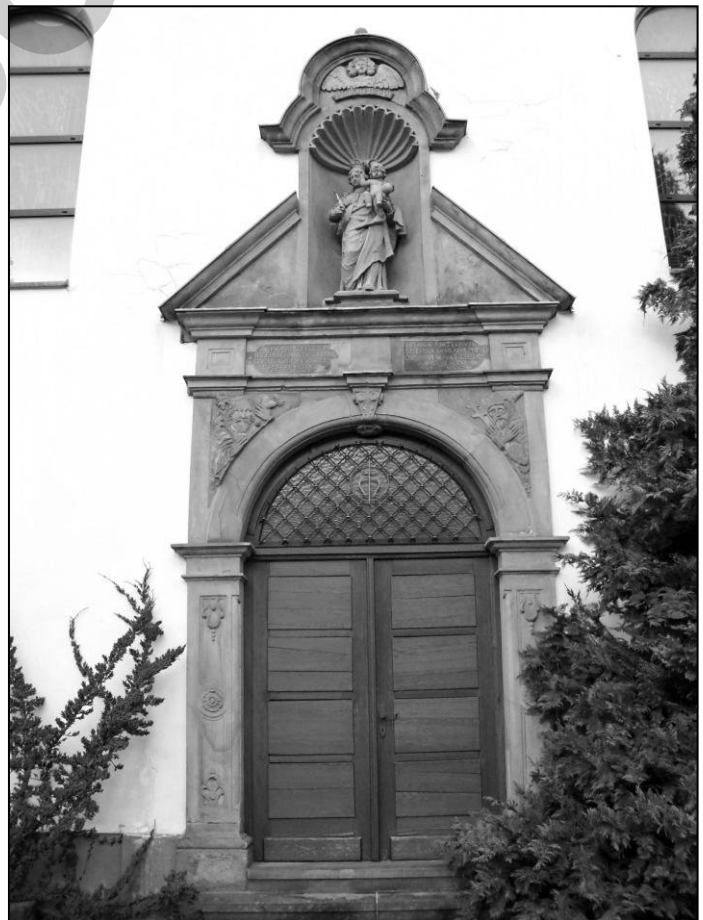
Eingangportal zur ehem. Kapuzinessenkirche

Damit ist die heilige Familie (Josef, Maria mit Jesuskind) in einem Portal gemeinsam versammelt und der Ordensvater, der heilige Franz von Assisi, ist auch dabei.