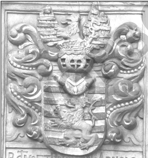
Wappen des Arnold von Horst

In früheren Zeiten wurde der Bau einer neuen Kirche häufig von einem großzügigen Spender finanziert, einem „Stifter“. Diese konnte, musste aber nicht Kleriker (Geistlicher) sein, sondern war häufig mit dem Ort, an dem die Kirche oder Kapelle errichtet werden sollte, persönlich verbunden. Mitspracherecht hatte seitens der Kirche dann als Nächstes natürlich immer der Bischof / Erzbischof / Fürstbischof des Bistums, der unter seinen „Angestellten“ einen Domdechanten hatte, der alle Bauten für ihn organisierte. Erst danach wurden – wie heute – Architekten, Bildhauer und Kirchenmaler gesucht, die den Bau ausführen konnten. Damit später jeder Besucher wusste, wer die Gebäude gestiftet hatte, brachten die edlen Spender über den Eingangsportalen ihre Wappen an. Sie zeigten durch Symbole den Beruf, sozialen Stand und die Herkunft ihres Besitzers und seiner Familie an.