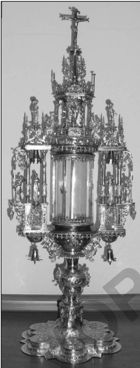
Monstranz der Kapuzinessen