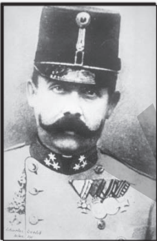
Erzherzog Franz Ferdinand