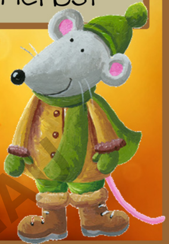
Illustration: mythja ( www.fotolia.com ) / andreapetrik ( www.fotolia.com )

eine Kartei zum: Lesen Rechnen Schreiben