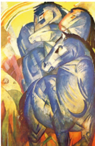
Franz Marc Turm der blauen Pferde 1913

Der Blaue Reiter - Anmalen und weitergestalten gehört zu der neuartigen Schulmalbuchreihe, die wahlweise als Schülerarbeitsbuch oder als Kopiervorlagenwerk einsetzbar ist. Sie führt konzeptionell innovativ und genial einfach direkt in das Leben und in das Werk der großen internationalen Künstler aus Vergangenheit und Gegenwart ein. Schüler aller Klassen und Schulformen erwerben begeistert Wissen, malen Bilder farbenprächtig an und gestalten sie ideenreich weiter. Mit fantastischen Ergebnissen belohnen sie sich selbst und werden schnell Kunstexperte. Lehr- und Lerneffizienz sind garantiert.