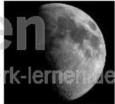
So kann der Mond aussehen, wenn wir ihn nachts am Himmel sehen!

Der Mond kreist Tag für Tag um die Erde, insgesamt braucht er für eine Umrundung etwas mehr als 27 Tage. Da er sich ständig um die Erde dreht, wird er Satellit der Erde genannt. Und da es in unserem Sonnensystem noch weitere Monde gibt, trägt er auch den Namen Erdmond. Wenn es dunkel wird, ist der Mond für die Menschen sichtbar. Nach der Sonne ist er für die Erdbewohner das Zweithellste, was sie am Himmel entdecken können. Dabei ist er mehr als 380.000 Kilometer von