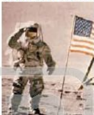
Neil Armstrong betrat als erster Mensch den Mond.

der Erde entfernt. Er besteht aus Gestein, ist etwa vier Milliarden Jahre alt und damit wahrscheinlich noch älter als die Erde.