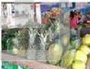
Ein Marktstand mit tropischen Früchten

Und was ist mit Ananas, Bananen und Co.??